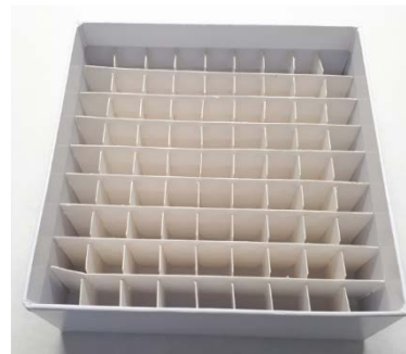
Caja de cartón (buffy coat)

Las instrucciones para el transporte del producto son (en ambos lotes):